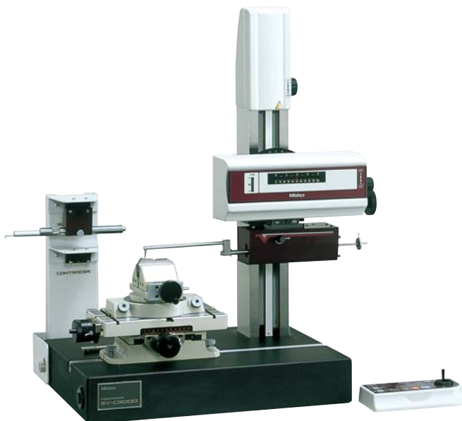
Formtracer SV-C 3000 S4