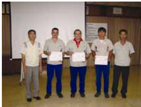
Melhores PAI do ano

Além do valor em espécie, houve alteração também no sistema de premiação individual, onde as mulheres terão um sorteio separado com maiores chances de ganharem os prêmios.