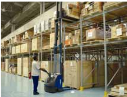
Setor Expedição (SZ)

Parabéns aos setores de Expedição (SZ) e ATI, pela organização e asseio.