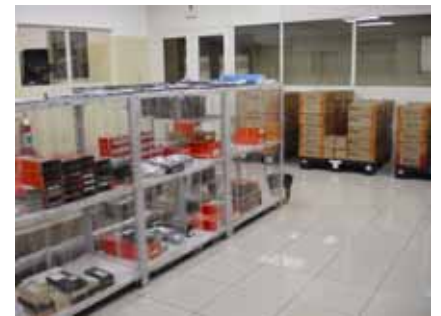
Setor ATI (SZ)