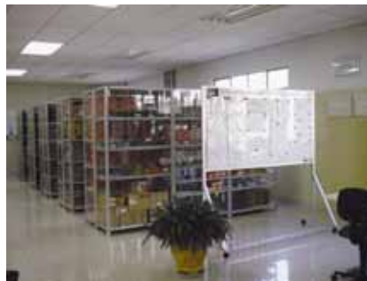
Setor ATI (SZ)