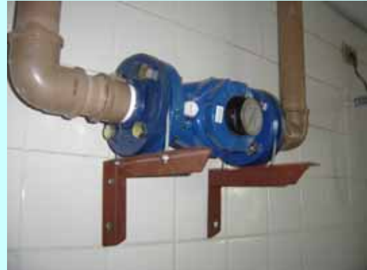
Hidrômetro instalado no refeitório