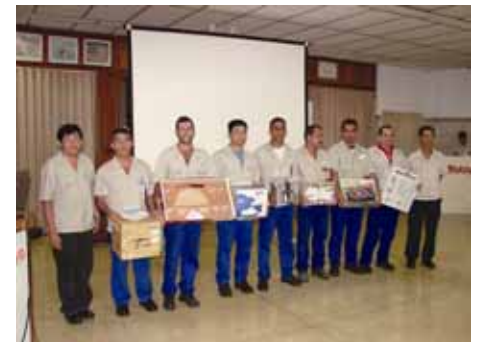
Premiação do PAI