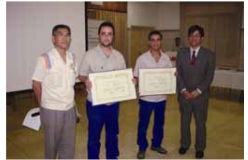
Representando os Setores de Montagem TD e Funilaria/Pintura