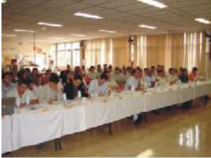
Vista Geral da 17ª Apresentação MPS, realizado em 24/11/2007. Participação dos funcionários e de toda Diretoria

Esperamos nesta 18ª Apresentação MPS, o desenvolvimento de bons temas, para que possamos gradativamente alcançar o Lema dos 35 anos da Mitutoyo. "Recuperar a confiança através dos 35 anos de experiência e saltar para uma nova etapa de crescimento", com a força da mão de obra de todos os funcionários.