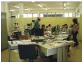
Planejamento e Logística (SZ)

Parabéns aos setores de Planejamento e Logística (novo depto), Montagem Base Magnética e Show Room (SP) pela organização e asseio.