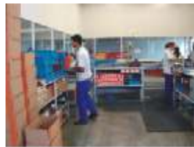
Montagem de Base Magnética (SZ)