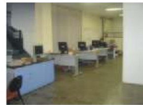
Show Room (SP)