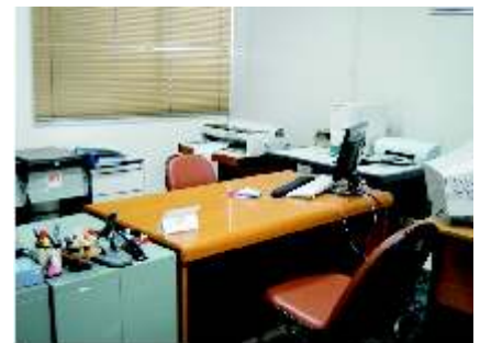
Recursos Humanos (SP)