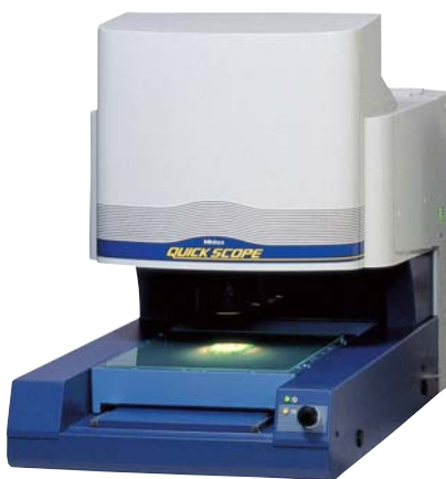
QUICK SCOPE CNC