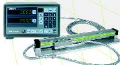
Escala Linear AT-112