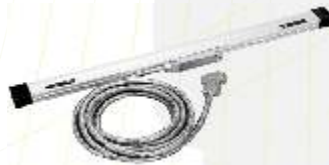
Escala Linear AT-112