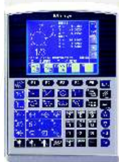
Processador Geométrico QM-DATA 200