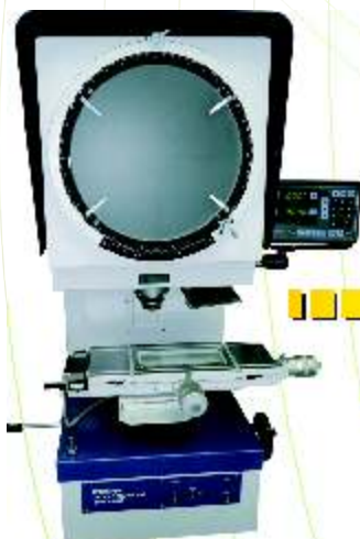
Contador Digital KA

Troca de cabeçotes micrométricos ou escalas antigas, por Sistema de Escalas Lineares AT-112, com Contador Digital KA.